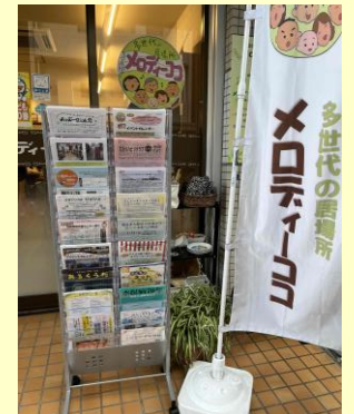
基金で購入した チラシスタンド

今回、かわさきまちづくり基金の贈呈式が開催され、メロディーココの活動を広げるために助成金を7万円いただきました。この助成金で、店舗の外に置く黒板やチラシスタンド、ハンガーラックを購入しました。みなさんからの応援に励まされ、これからもココの居場所づくりに努めていきます。