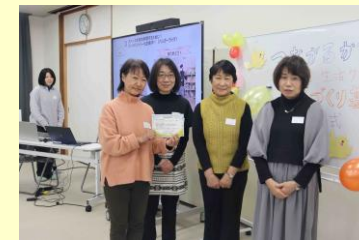
基金の贈呈式より

「生活クラブまちづくり基金」は、地域に必要な市民活動・つながりを育むための取り組みです。この基金は、生活クラブ組合員の皆さまからの毎月100円の寄付をもとに、地域の福祉・ケア、食や農、環境・エネルギー、協同労働などをテーマとした活動や市民事業に助成を行います。