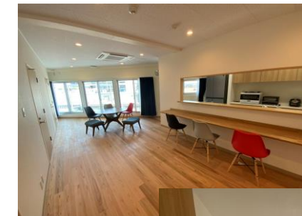
リビング ダイニング

私たちワーカーズ・コレクティブメロディーが「Nagomo 矢向」のサポートを請け負っています。週2回、入居者の食事づくりやお掃除を通して、入居者の方を見守っています。