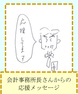
会計事務所所長さんからの応援メッセージ

さまざまなエピソードがメロディーココで生まれています。未来を担う子どもたちに応援メッセージを添えて毎月寄付をしてくださる近隣の会計事務所の所長さんがいらっしゃいます。毎週火曜日の「ふまねっと運動」に通われている方が、