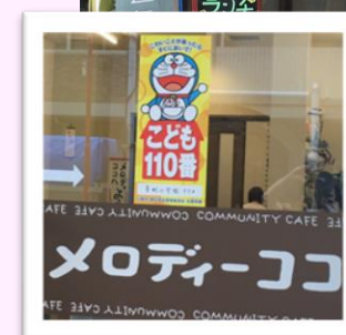
メロディーココは「子ども110番」に登録しました