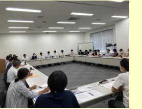
フォーラムの風景

私たちワーカーズ・コレクティブメロディーは、生活クラブ生協の組合員や川崎市内で福祉事業を行っている他のワーカーズ・コレクティブとともに、市内の福祉について検討するユニットという会議を持っています。毎年ユニットで討議しまとめたものを政策提言として川崎市に提出しています。8月22日に、川崎北、高津・宮前、川崎南部の3ユニットが合同で、政策提言に対する川崎市からの回答について川崎市職員の方達と意見交換を行いました。要支援の方を対象とした「介護予防・日常生活支援総合事業」や「産前・産後家庭ヘルパー派遣事業」、公共施設の整備やコミュニティ交通の充実などの課題について、私たち事業者や市民が感じている現状を伝えました。川崎市の施策が私たちの暮らしによりよいものになるようにこれからも活動を続けていきます。