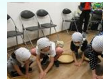
手ぬぐいをつけて、可愛 い子どもたちの安来節