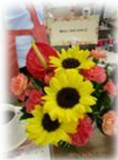
みなさんからのお祝いのお花が届きました