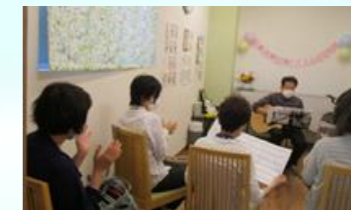
70年代のフォークソ ングを中心にマスクをしな がらくちずさみました。