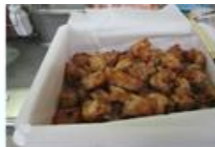
ココ食堂、今夜は大人も子ども も大好きな鶏のから揚げ