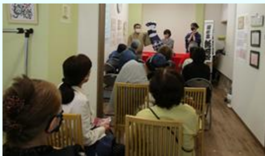
大トリは「やかん寄席」抽選会もあり 大盛り上がりでした。