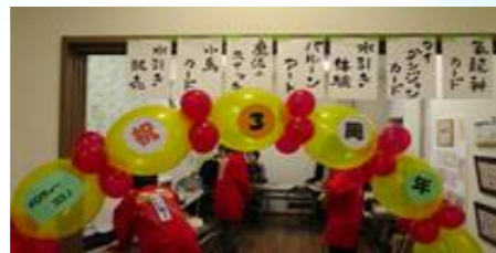
バルーンアートで飾り付け♡