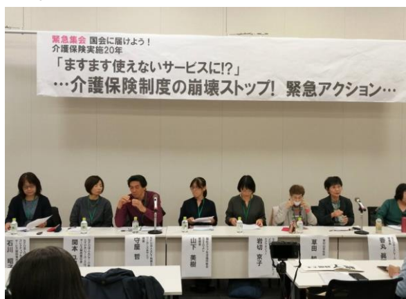
10月院内集会の登壇者のみなさん

10月28日に衆議院第一議員会館で行なわれた院内集会では、メロディーのケアマネジャーも参加して、介護現場の実態を国会議員や厚労省に訴えました。