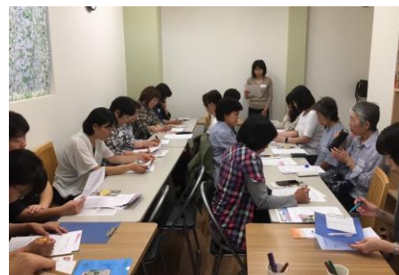
第2回の様子 みなさん真剣！

第3回の「はじめよう！人生会議」は、人生の最終段階でどんな医療やケアを望むかを、「もしバナゲーム」というカードを使って考えようという内容でした。講師の説明を聞きながらメモをとったり、カードを前に色々悩む姿がみられ、参加者の真剣な取り組みがうかがえました。連続して参加した組合員も多く、グループワークやゲームを通して参加者同士が話すことができ、顔の見える関係作りにつながりました。