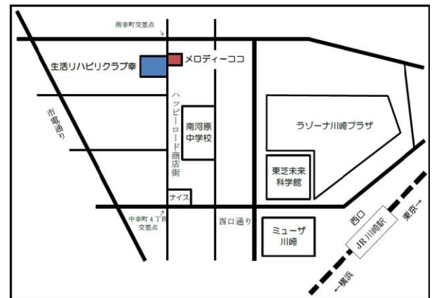
生活リハビリクラブ地図