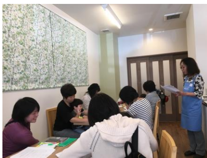
ココで参加型福祉のお話

そして利用者さんとのふれあいのひとときは、若いママさんにとっても貴重な時間だったようです。普段なかなか接することのない小さなお子様の訪問はとても喜んでいただけました。