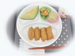
6月はおいなりさんでした

ココ食堂は子どもから高齢の方などどなたでも参加していただける食堂です。徐々に参加者が増え、品切れで時間前に終了してしまうこともあります。季節を感じるメニューを工夫して、お子さん連れやお友達同士など、皆さん楽しく食事をしています。ココ食堂での交流を通じ、地域のつながりが豊かになるといいなと思っています。