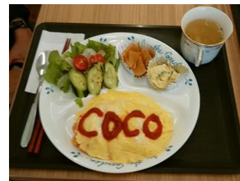
ワンコインランチ

楽しく歌う音楽のひとつ なつかしい歌・季節の童謡や唱歌 昭和の歌謡曲・フォークソングも！ 不定期 水曜日 午前 11:00~12:00 1ドリンク(200円)ご注文ください。