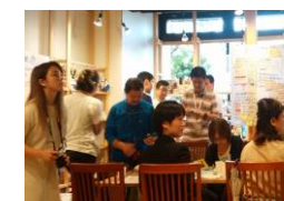
各グループの発表

少子高齢化や人口減少の加速、働き方の多様化など、暮らしを取り巻く環境が大きく変化することが見込まれています。